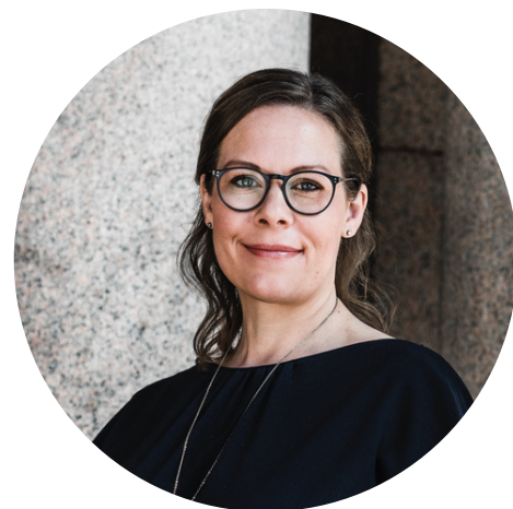
Maria Malmer Stenergard, Årsmötetalare